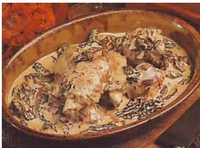
LE COQ AU VIN JAUNE ET AUX MORILLES